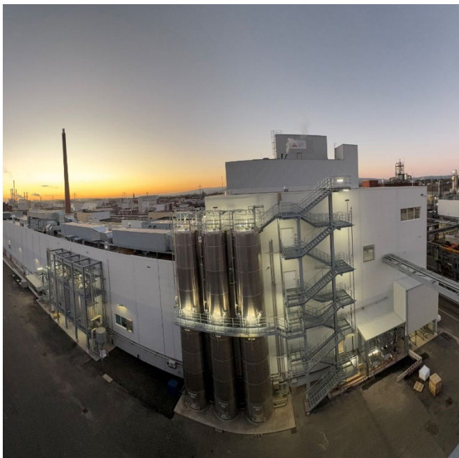
Produktionsgebäude der neuen Polyesterfolien-Anlage im Industriepark Wiesbaden

Wir bringen fundiertes Fachwissen und führende materialwissenschaftliche Kompetenz in Kernmarktsegmenten wie Mobilität, Digitaltechnik, Medizin und Lebensmittel ein. Gemeinsam ermöglichen wir mit rund 70.000 Mitarbeitern den industriellen Wandel, technologische Durchbrüche und ein längeres, erfüllteres Leben für uns alle.